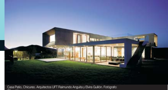
Casa Patio, Chicureo, Arquitectos UFT Raimundo Anguita y Elvira Guillón.