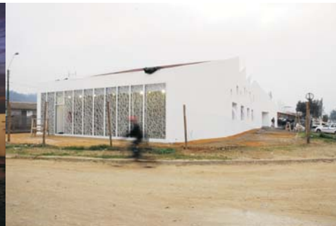
Biblioteca Pública de Licantén, Arquitecto UFT Enrique Browne C.