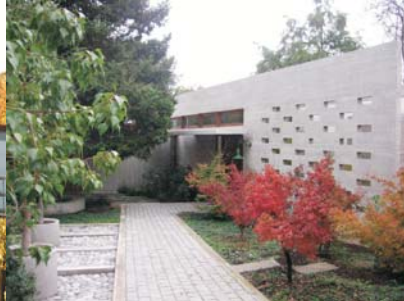
Casa San Damián, Arquitectos Pablo Bronstein (UFT), Macarena y Diego Aguilar.