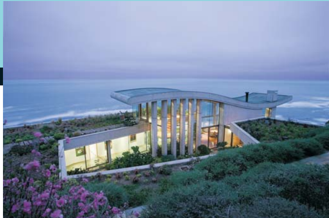
Casa Zapallar, Arquitectos UFT Raimundo Anguita y Elvira Guillón.