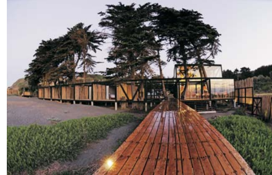
Hotel Surazo, Matanzas, VI Región, Arquitectos UFT Felipe Wedeles y Jorge Manieu.