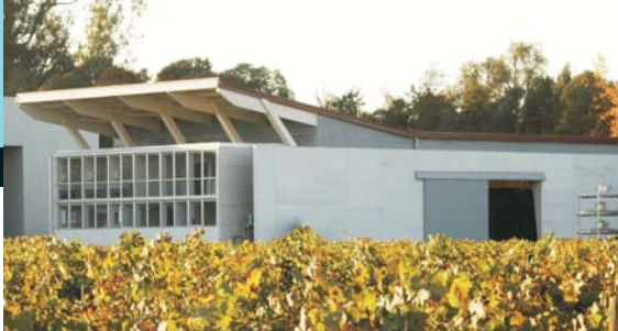
Bodega Vña Conosur, Chimbarongo, Arquitectos UFT Andrés Westendarp y Juan Ignacio Claro.