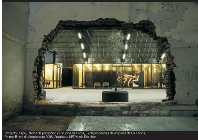
Proyecto Pulpo, Oficina de publicidad y Estudios de Fotos, Ex dependencias de empresa de Sal Lobos, Premio Bienal de Arquitectura 2008. Arquitecta UFT Hania Stambuk.