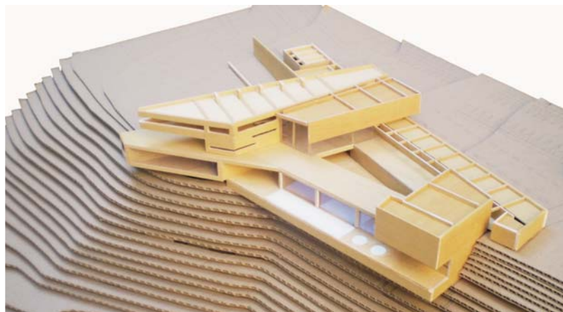
Taller de Título Profesores Emilio Duhart y Baltazar Sánchez. Proyecto: Lugar para eventos masivos en las Vizcachas, Cajón del Maipo. Foto del Club House. Autor: José Tomás Ríos.