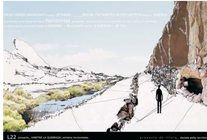
L22 proyecto_HABITAR LA QUEBRADA_estratos horizontales proyecto de título_daniela Peña Corvillon